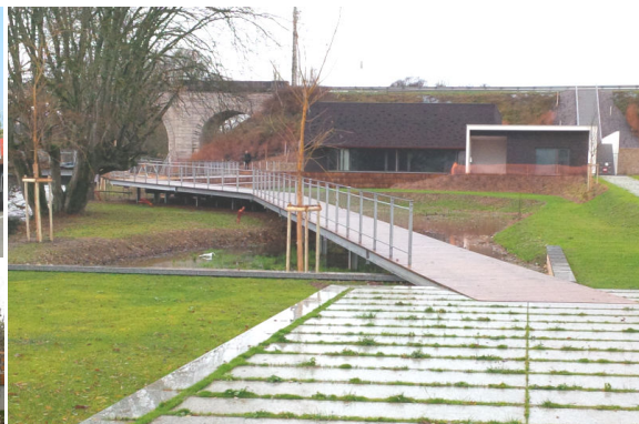
Aménagement des rives de l'Ornain à Gondrecourt-le-Château