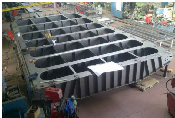
Fabrication de vantaux de rechange de grand gabarit (13m x 7m) pour la Moselle canalisée (Voies Navigables de France)

Sur les canaux d'importance internationale, comme c'est le cas de la Moselle canalisée, il peut être utile de stocker des vantaux de portes d'écluse de rechange, à portée de grutage, prêts à être utilisés.