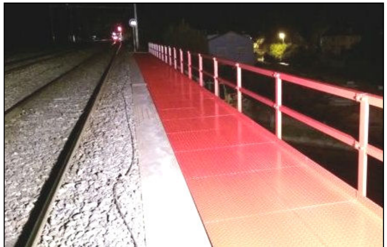
1 – Montage de la tour des Commissaires, hippodrome de la Hardt, 67160 Wissembourg 2 – Montage des terrasses et pontons sur les rives de l'Ornain, 55130 Gondrecourt-le-Château 3 – Montage de l'élargissement d'accotement de sécurité sur pont TGV, 67550 Vendenheim